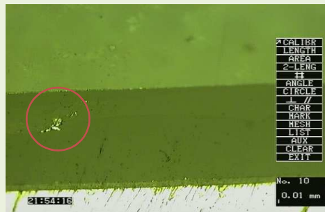
・皮膜内異物の断面画像